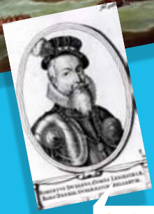
Graaf van Leicester