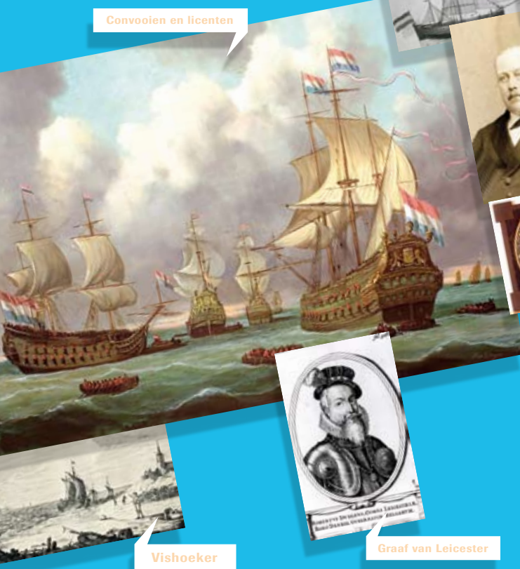
Convooiën en licenten

In 2007 wordt de organisatie van de Douane te water overgenomen door de nieuwe Rijksbrede rederij. Alle schepen in overheidsdienst zijn in deze rederij opgenomen.